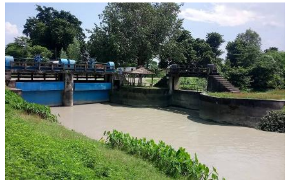
❖ नेपालतर्फ पानी जाने नहर

कञ्चनपुर जिल्ला कृषिका लागि उर्वर जिल्लाको रूपमा परिचित छ र यहाँका अधिकांश घरपरिवारहरू कृषि पेशामा आवद्ध छन् । तर विडम्बना सिचाईका लागि बनाईएको महाकाली नहरमा नेपाल तर्फ पर्याप्त र समयमा पानी नआउदा खेतियोग्य जमिन बाभ्रै राख्नुपर्ने बाध्यता छ । यसकारणले कृषि उत्पादनमा प्रतिकूल असर परिरहेको छ । महाकाली नदीको पानीको उपभोगमा भारतको एकाधिकारका कारण वर्षादमा बाढी सँगै आउने बालुवा लगायत फोहरले नहरको सतह पुरिँदै गएकोले नेपाल तर्फको नहरमा पानीको श्रोतमा कमी भई सिचाईको अभाव भई रहेको छ । मानव अधिकारको उपभोगको सन्दर्भमा राज्यका अन्तरदेशीय दायित्व र मौलिक हकको रूपमा संवैधानिकरूपमा सुनिश्चित भएको खाद्य अधिकारको सवालसँग प्रत्यक्ष सरोकार राख्ने समुदायको यो सवालमा फियान नेपालले अक्टोबर २०१८ देखि सहजीकरण गर्दै आएको छ ।