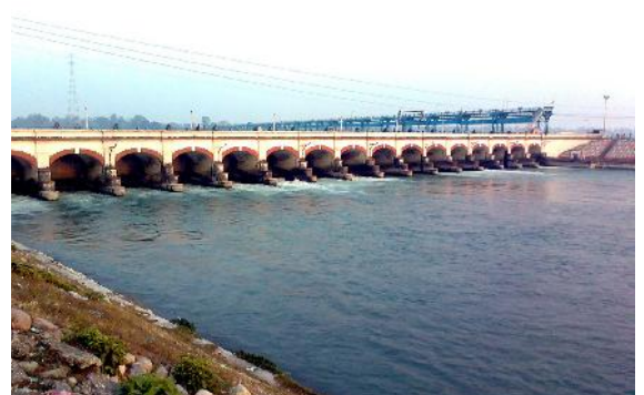
❖ भारततर्फ पानी जाने नहर